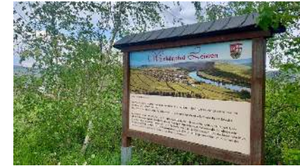
Weinehrpfad Leiwener