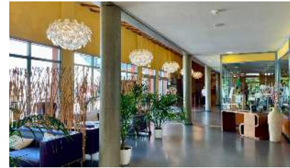
Eurostrand Moseltal