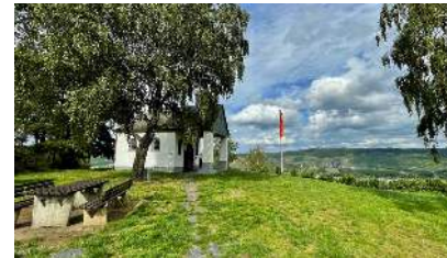
Leiwener Kapellenchen