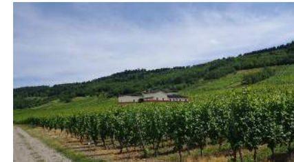
Römische Villa Bohnengarten